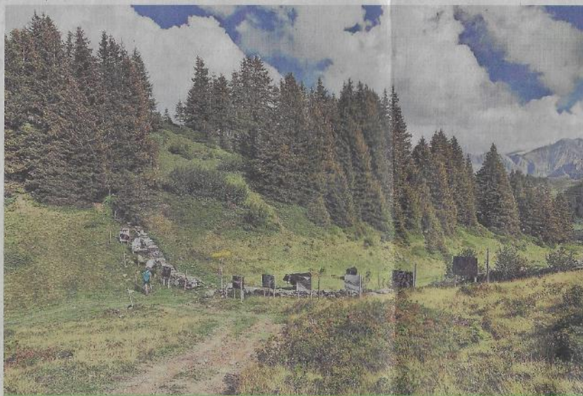
Deux parcours sont proposés traversant forêts et pâturages, l'un adapté aux personnes à mobilité réduite et l'autre aux bons marcheurs.

Pour les bons randonneurs, une marche, nécessitant de